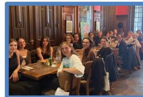
sfeerbeelden uit een vorige editie van onze zomercursus