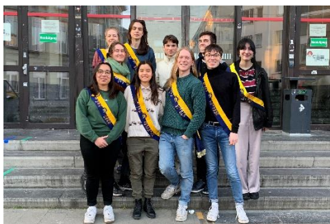
het praesidium 2021-22